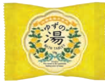
バスタブレット 予定上代: ¥230+税 ロット:6P 内容量: 50g 外装サイズ:W105×D15×H80mm