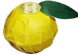
バスボム 予定上代: ¥360+税 ロット:6P 内容量: 150g 外装サイズ: φ72×H72mm