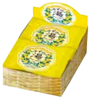
6個入り ディスプレイボックス サイズ:W95×D138×H53mm