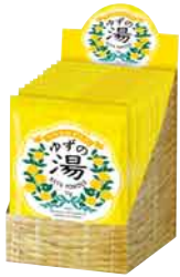
12個入り ディスプレイボックス サイズ:W92×D110×H130mm