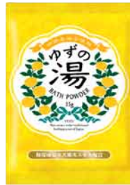
バスパウダー 予定上代: ¥200+税 ロット:12P 内容量: 35g 外装サイズ:W90×D10×H130mm