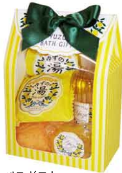
バスギフト 予定上代: ¥1,200+税 ロット:3P 外装サイズ:W130×D70×H185mm